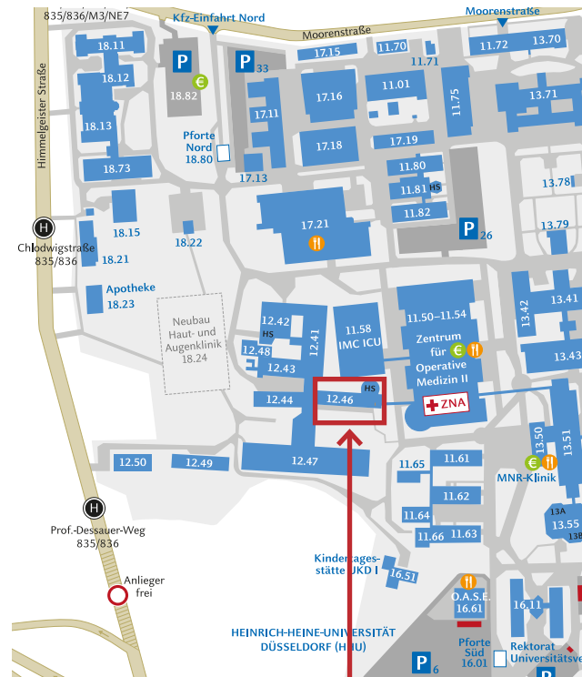
Universitätsklinikum Düsseldorf, Gebäude 12.46 (Alte Chirurgie)

https://www.uniklinik-duesseldorf.de/anreise